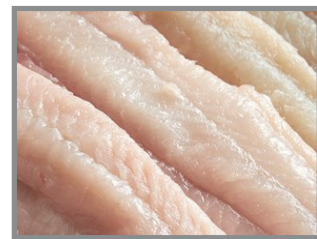
Filetes de pez bagre azul de la bahía de Chesapeake