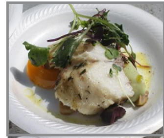
Delicioso pez bagre azul de la bahía de Chesapeake

Los servicios de comedor de la Universidad de Maryland sirven pez bagre azul de la bahía de Chesapeake en el campus y lo incluye en menús y promociones. Un estimado de 7,265 libras de pez bagre azul se sirvió en el campus durante el semestre de otoño de 2019.