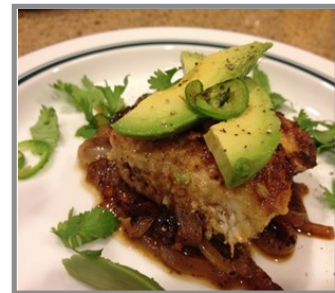
Verdes en azules, un plato de inspiración latina con pez bagre azul de la bahía de Chesapeake